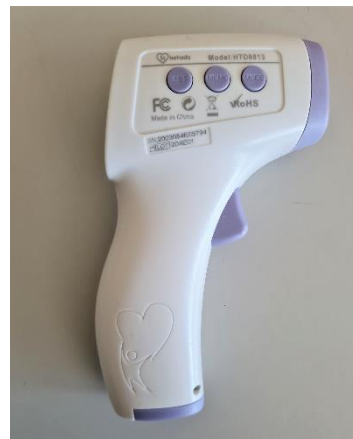
Exemplos de atividades realizadas no âmbito do projeto.